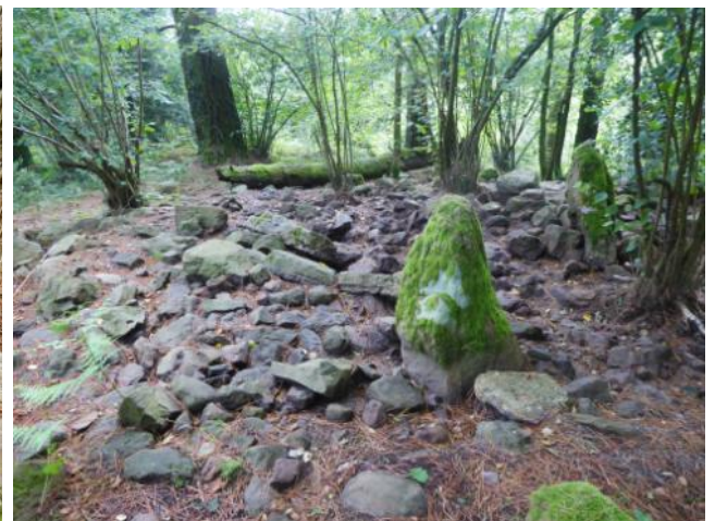
06 de Agosto de 2.019.