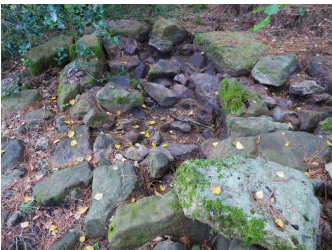
06 de Agosto de 2.019.