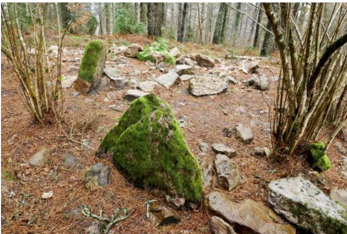
30 de Enero de 2.019.