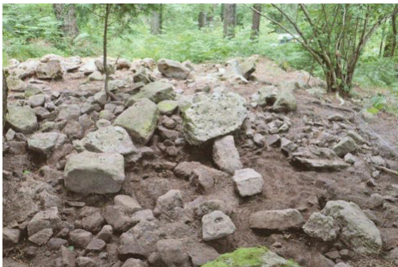
Txangostako egituraren indusketa arkeologikoa.