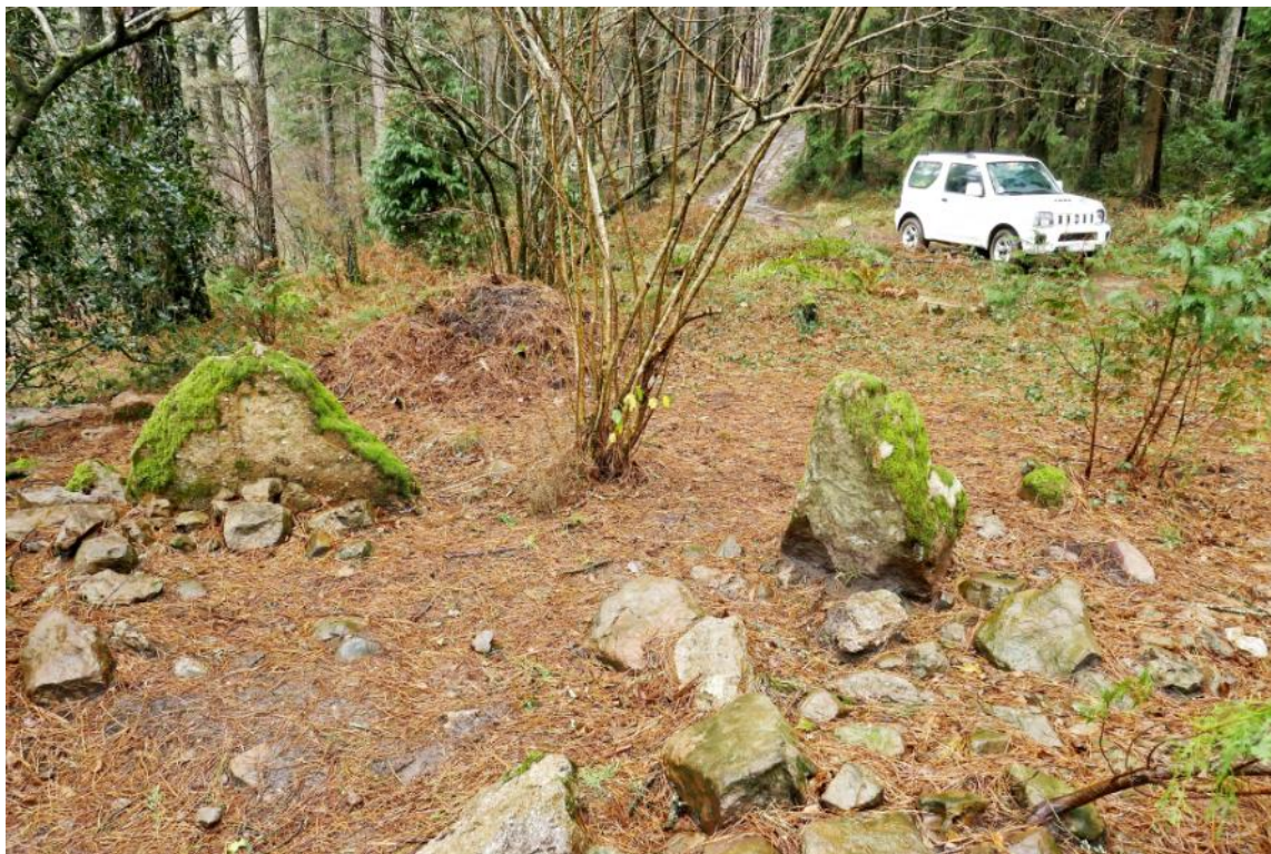
30 de Enero de 2.019.