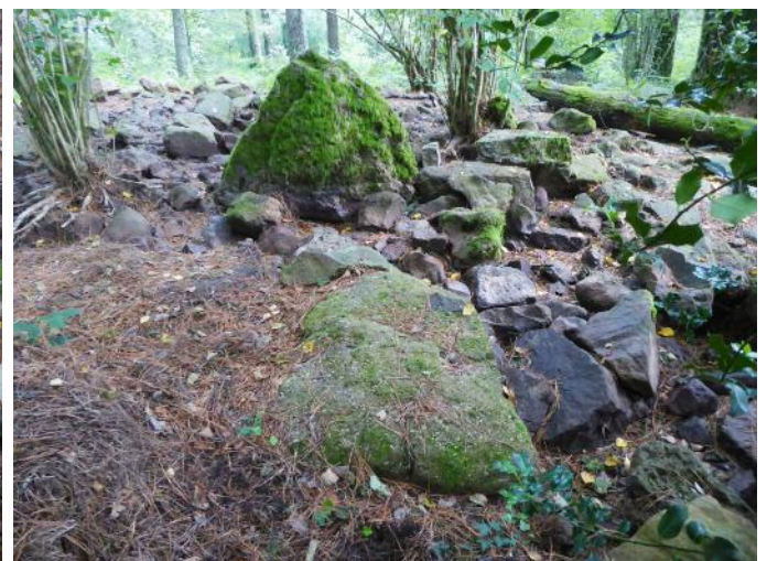
06 de Agosto de 2.019.