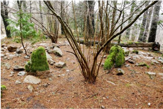
30 de Enero de 2.019.