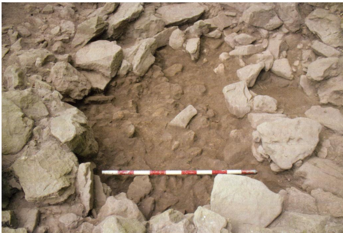
Trikuharriaren ganberaren irudi zenitala.

2.020 Quevedo Semperena, Izaro – Ceberio Rodríguez, Manu. Dolmen de Txangosta. Cuenca baja del Oria: montes Andatza, Belkoain, Garate y Zarate. Arkeoikuska 2.019. Vitoria-Gasteiz, pp. 472-473.