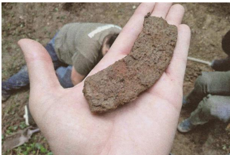
Irigainen azaldutako zeramika zati bat. MANU CEBERIO

Azken urte hauetan egindako aurkikuntza oso garrantzitsua da, horrelako egiturak ezezagunak ziren inguru batean kokatzen delako (ezagutzen diren megalitoak hegoaldeko isurialdean kokatzen dira) eta inguruan bizileku bat kokatu izan zela erakusten duelako.