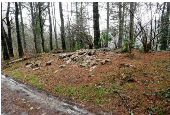
30 de Enero de 2.019.