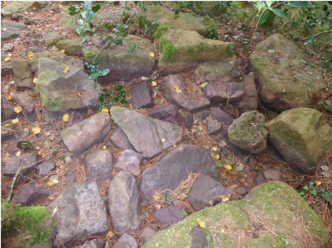
06 de Agosto de 2019.