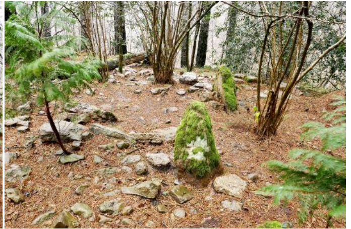
30 de Enero de 2.019.