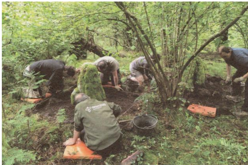
Txangostako egituraren indusketa arkeologikoa.