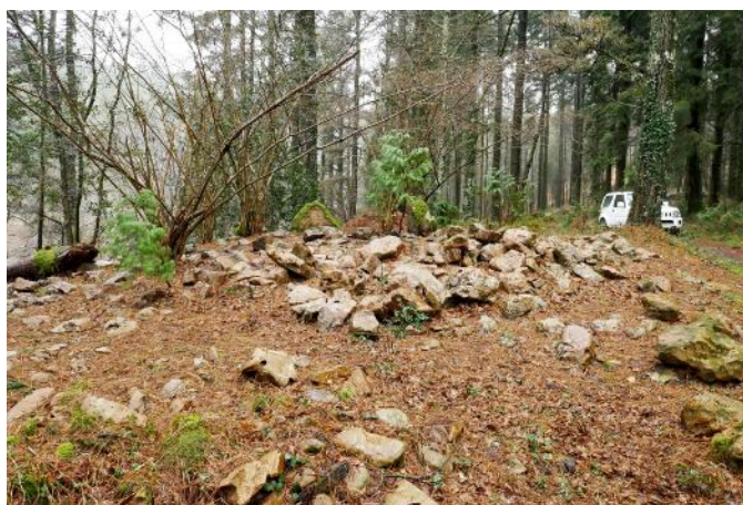
30 de Enero de 2.019.