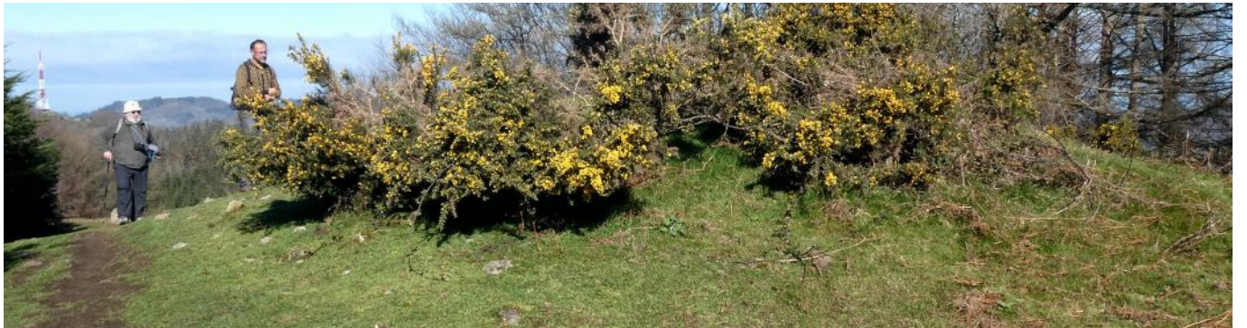
13 de marzo de 2.021.