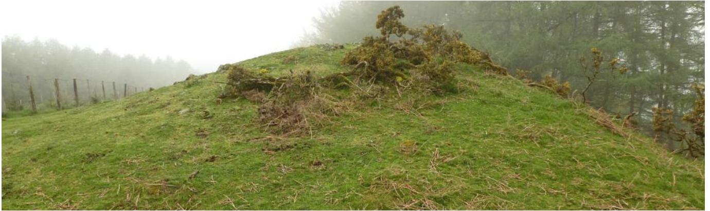
04 de mayo de 2.013.