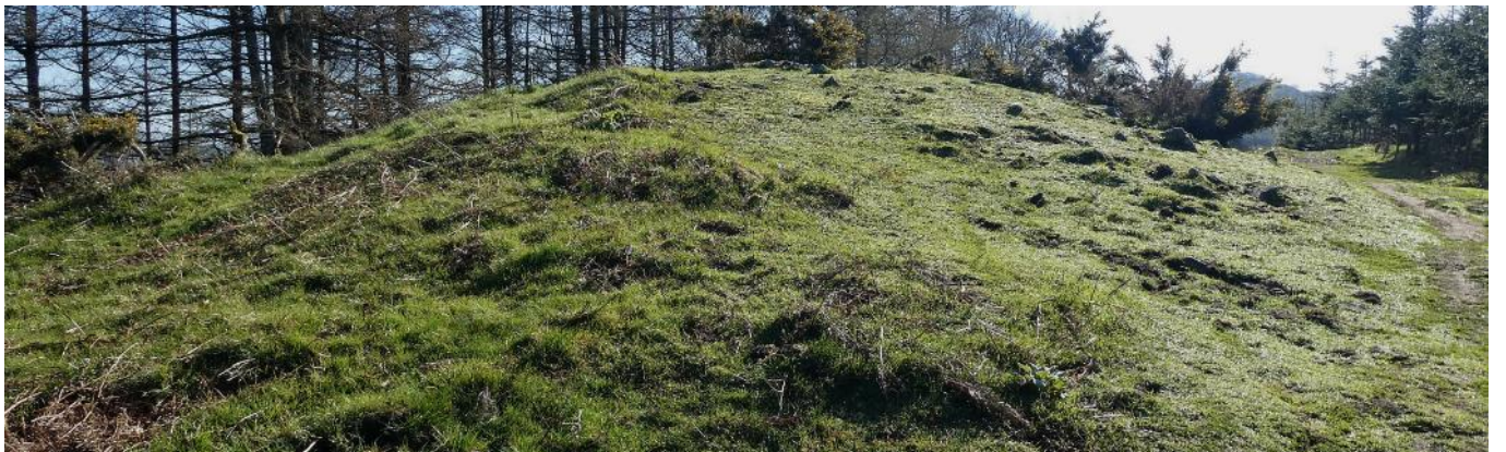
13 de marzo de 2.021.