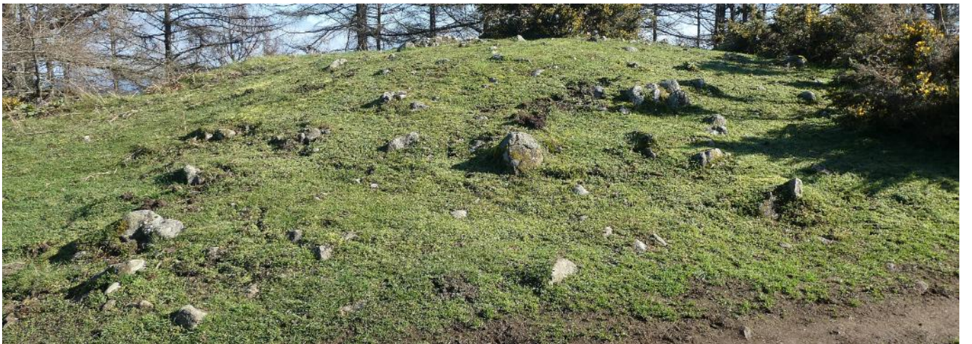
13 de marzo de 2.021.