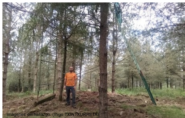
Imágenes del hallazgo. (Iñigo TXINTXURRETA)

El dolmen descubierto por Iñigo Txintxurreta fue construido a unos 400 metros de altitud sobre el nivel del mar, tiene 14 metros de diámetro y una altura de 1,20 metros. Está formado por piedras areniscas, y en el centro del monumento, aunque se encuentra removido, se aprecian cuatro losas bien hincadas pertenecientes a la cámara dolménica.