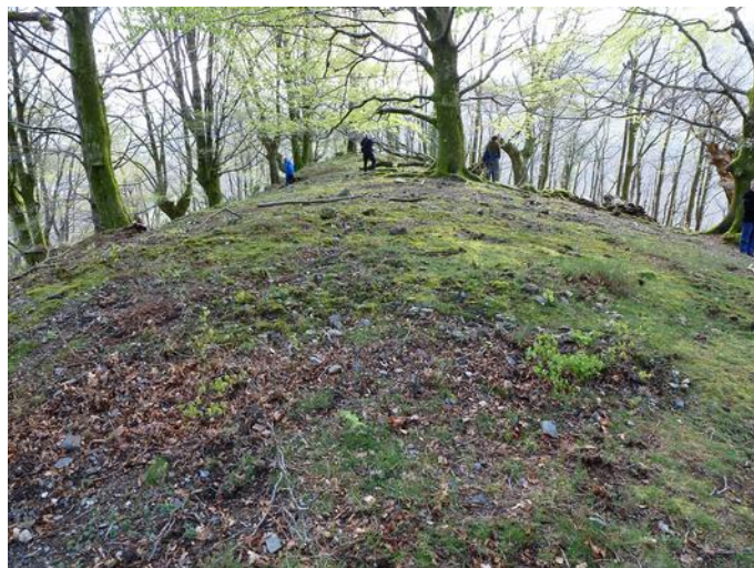
20 de Abril de 2.013.