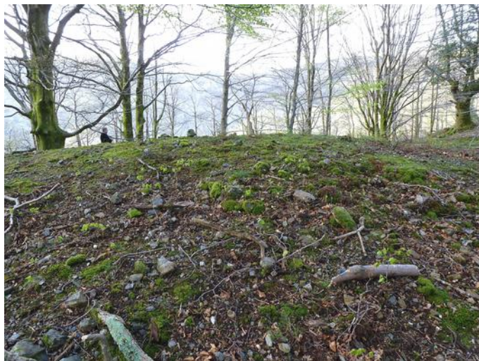
20 de Abril de 2.013.