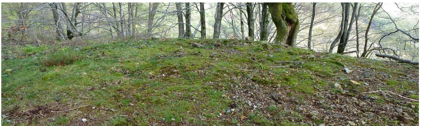
20 de Abril de 2.013.