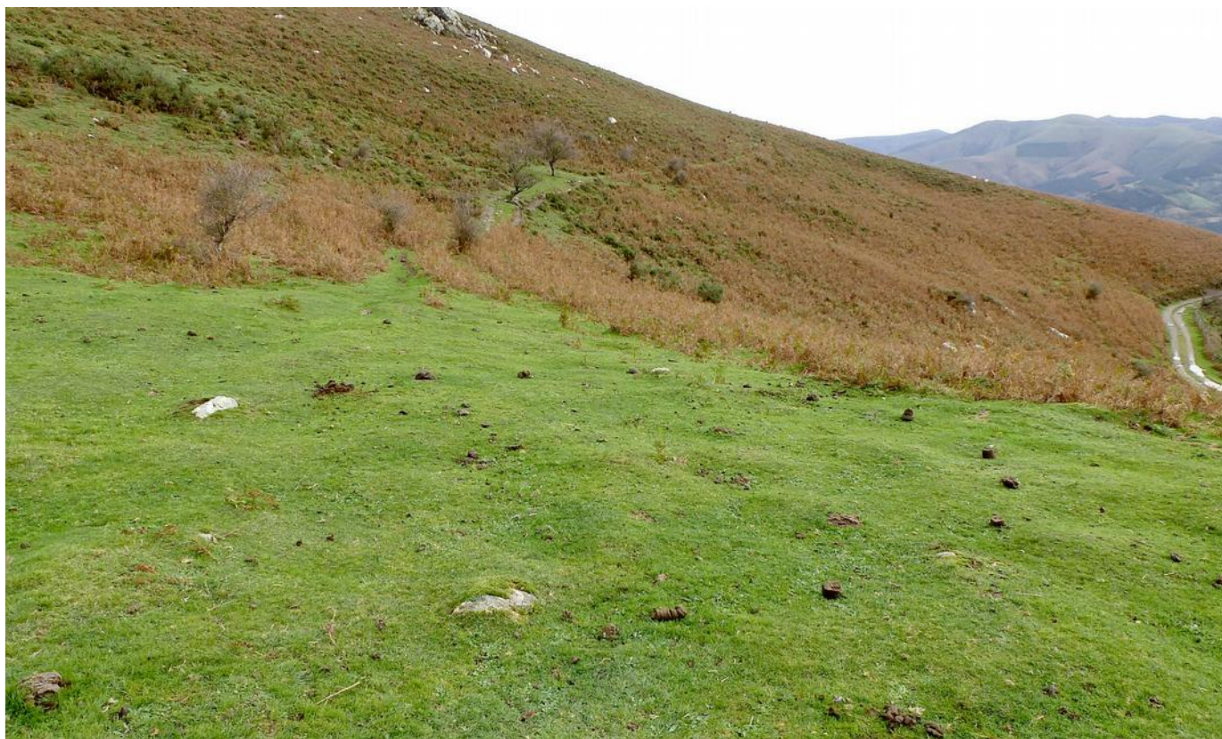
09 de Noviembre de 2.013.