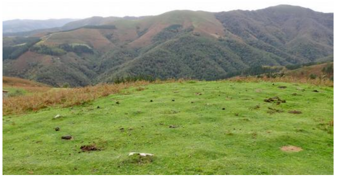
09 de Noviembre de 2.013.