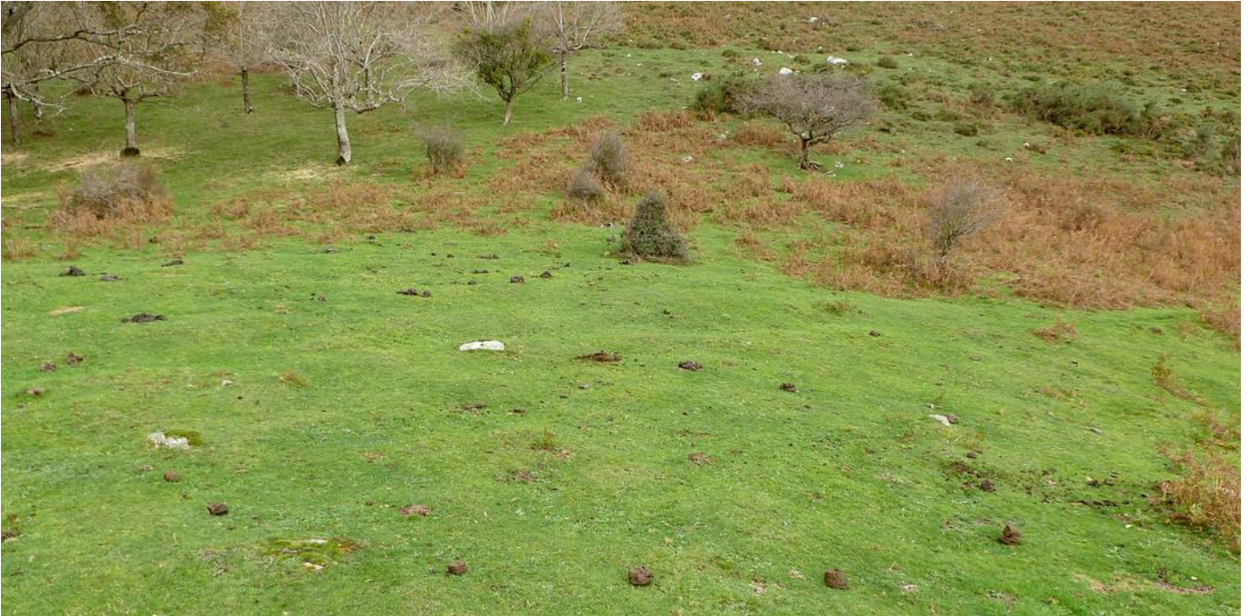
09 de Noviembre de 2.013.