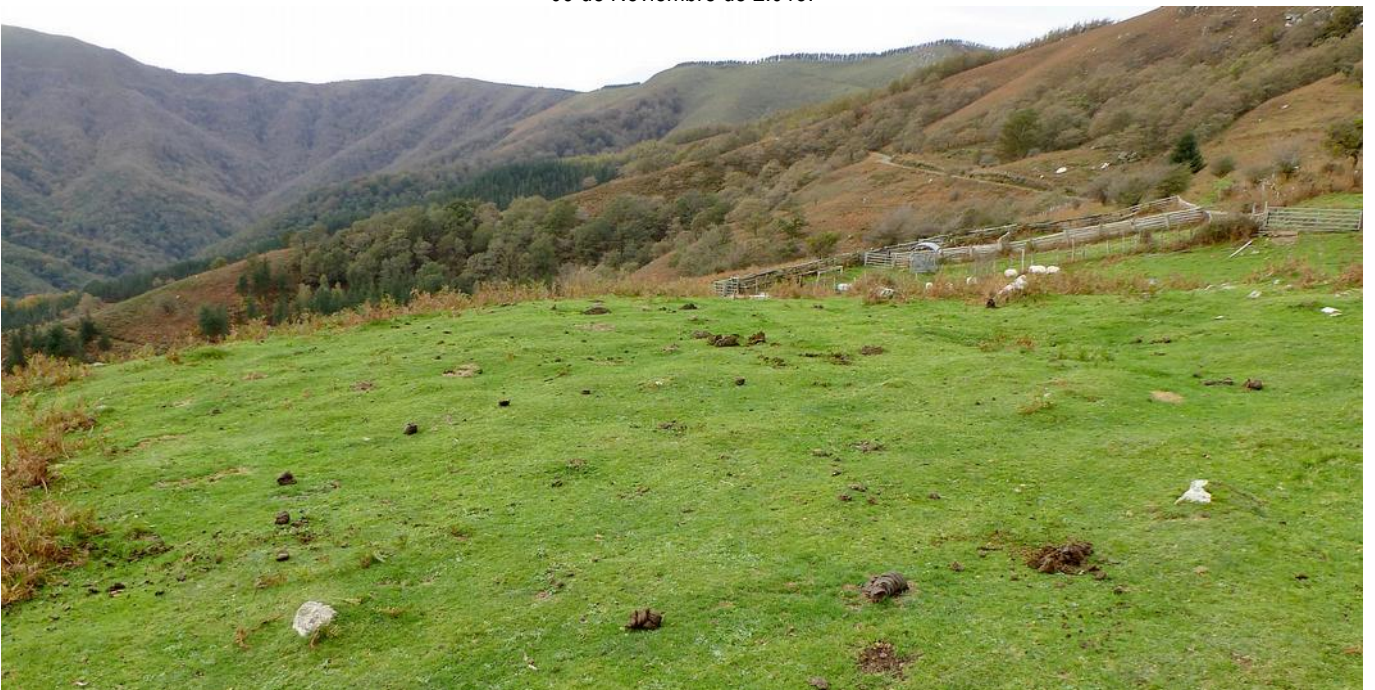
09 de Noviembre de 2.013.