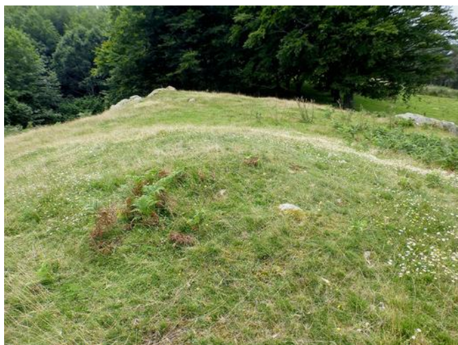
10 de Agosto de 2.014.