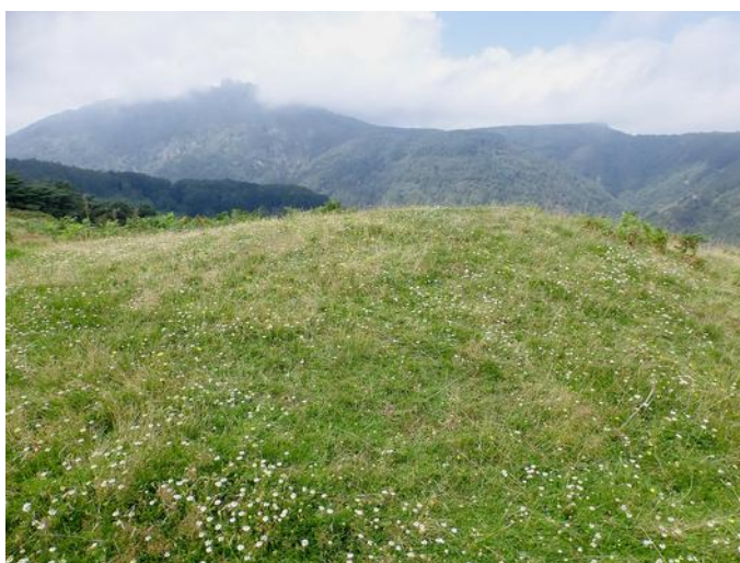
10 de Agosto de 2.014.