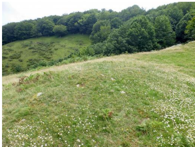
10 de Agosto de 2.014.