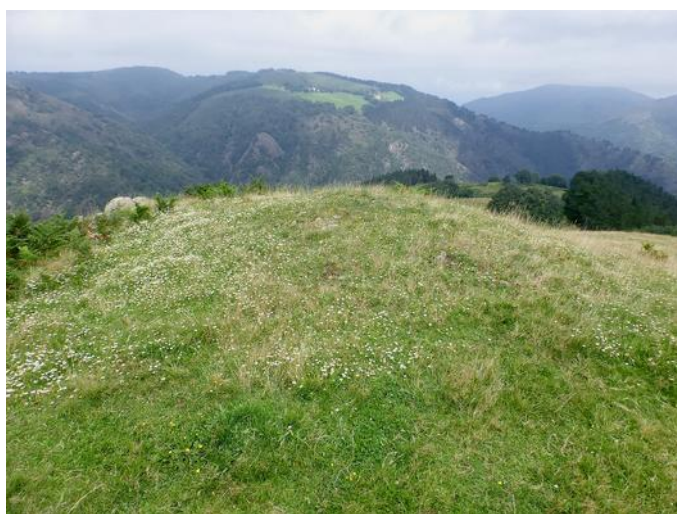
10 de Agosto de 2.014.