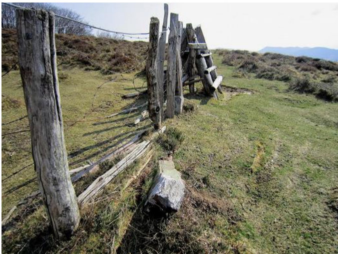
03 de Marzo de 2.012.