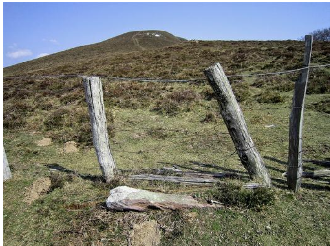
03 de Marzo de 2.012.