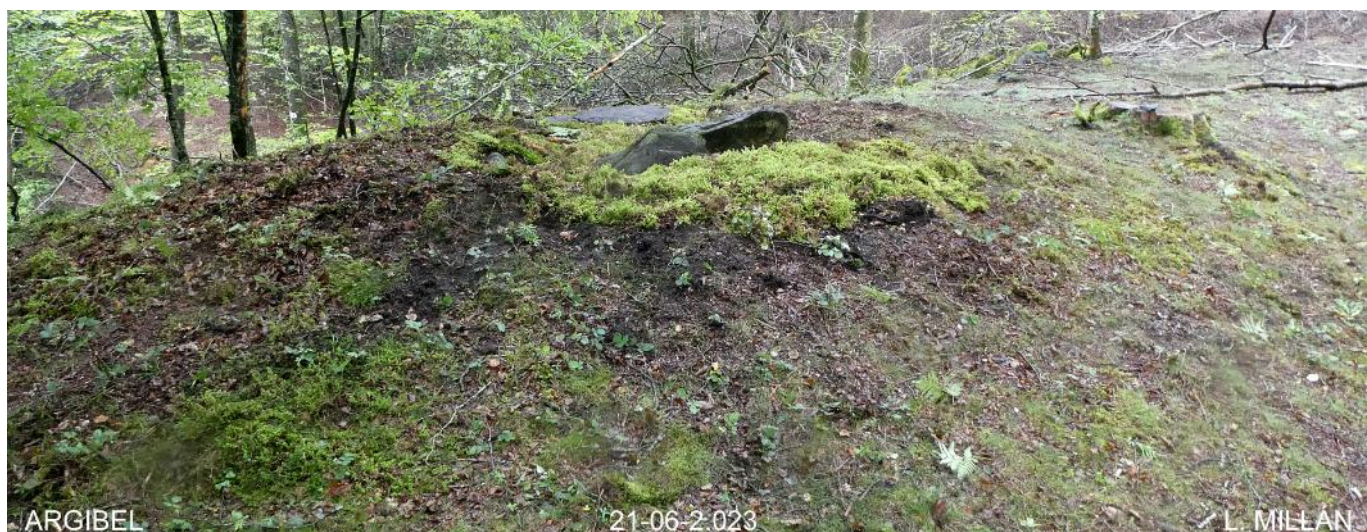
ARGIBEL 21-06-2023