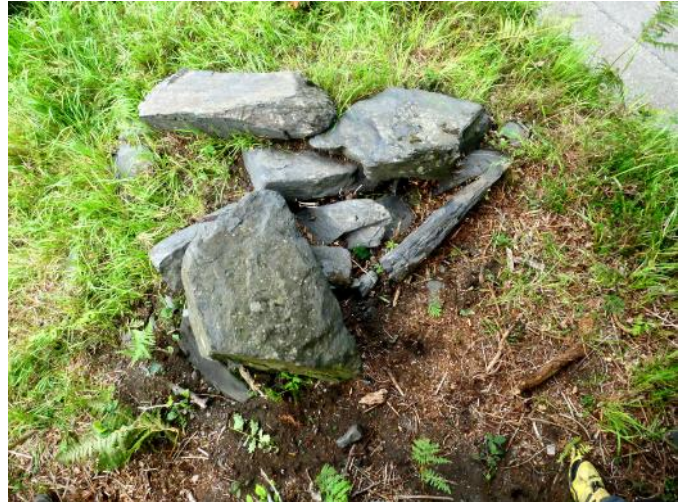
03 de Julio de 2.021.