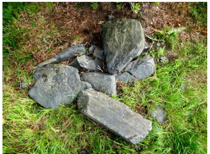
03 de Julio de 2.021.