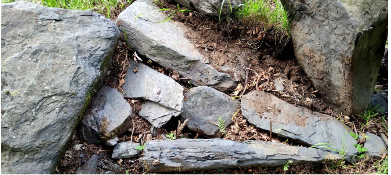
03 de Julio de 2.021.