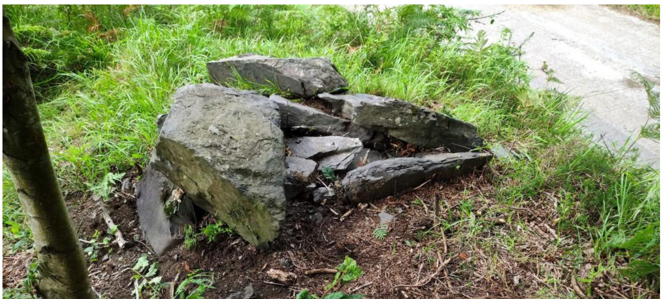
03 de Julio de 2.021.