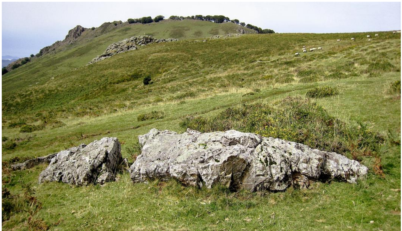
25 de Agosto de 2.007.