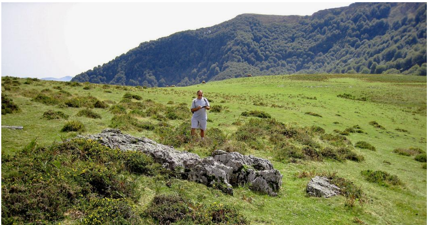
25 de Agosto de 2.007.