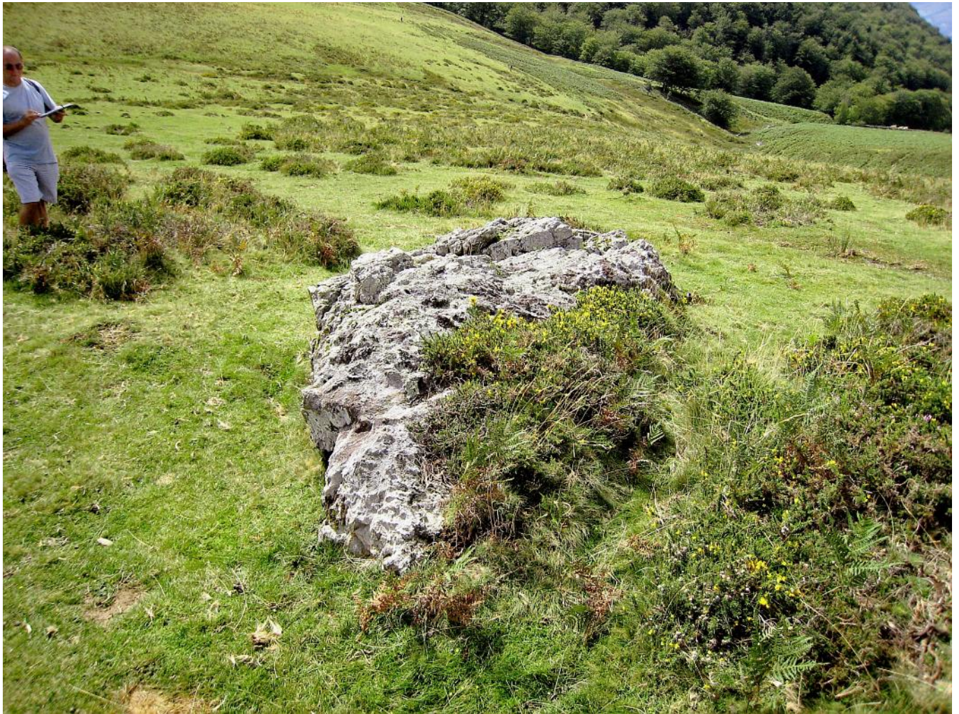
25 de Agosto de 2.007.