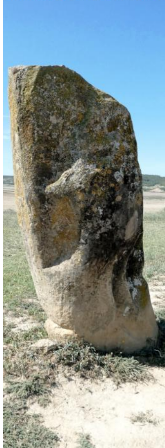
PIEDRALARGA CARA NORTE

1,90m de alto. 0,80m de ancho abajo. 0,80m de ancho en medio.