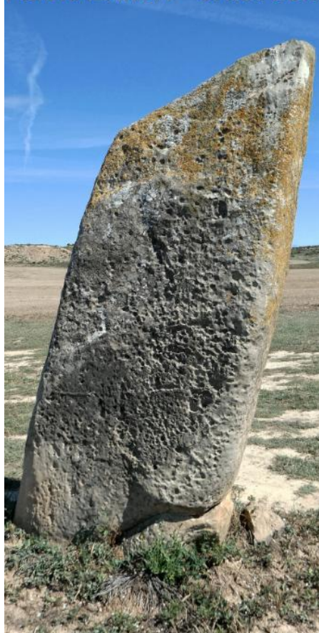
PIEDRALARGA CARA SUR

2,10m de alto. 0,95m de ancho abajo. 0,95m de ancho por la mitad. 0,85m de ancho arriba.