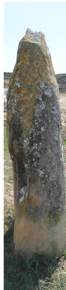
PIEDRALARGA CARA OESTE

1,75m de alto. 0,35m grosor base. 0,40m grosor en la mitad. 0,20m grosor arriba.