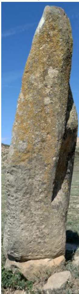
PIEDRALARGA CARA ESTE

1,95m de alto. 0,35m de ancho. 0,13m en la punta.