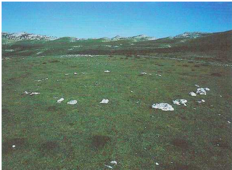
39. argazkia. Balsa Fríako harrespil multzoa.

Lizarragako tuneletik Peña Blanca I-ra inguratzen duen pistaren eskuinean, Andiako larreetan.