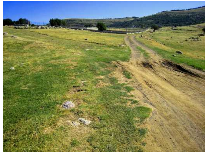
04 de agosto de 2.009